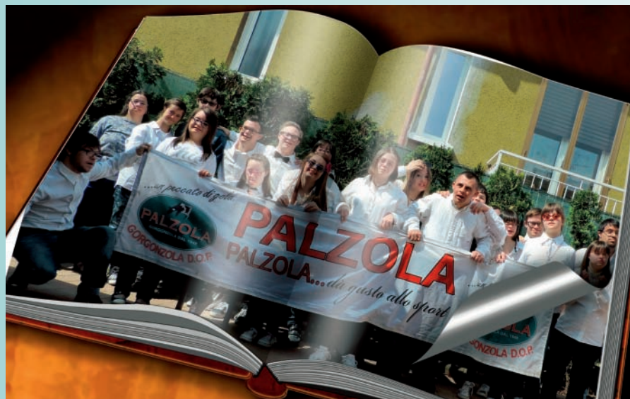
I ragazzi dell'Associazione + di 21 down