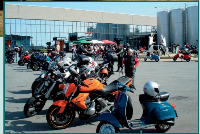
Il motoraduno del Moto Club Mad Cat 73